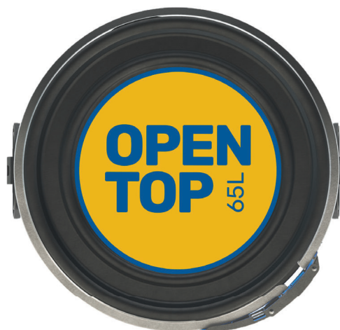
НАНЕСЕНИЕ ЭТИКЕТКИ НА КРЫШКУ