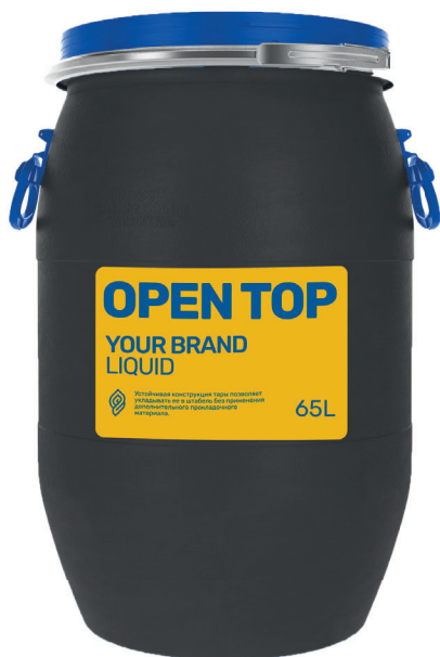
БОЧКА 65 л