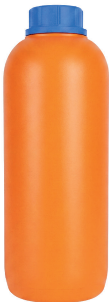
ФЛАКОН КРУГЛЫЙ 1Л