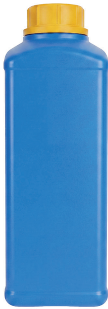
ФЛАКОН КВАДРАТНЫЙ 1Л