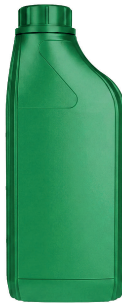
ФЛАКОН «ЕВРО» 1Л