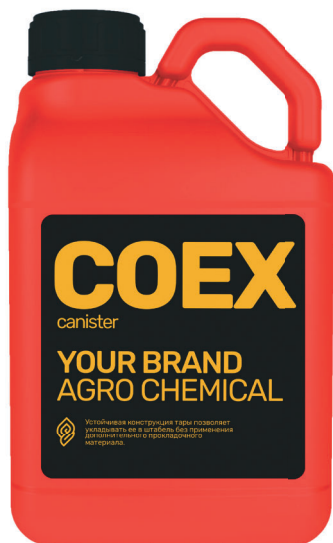
КАНИСТРА 5 Л