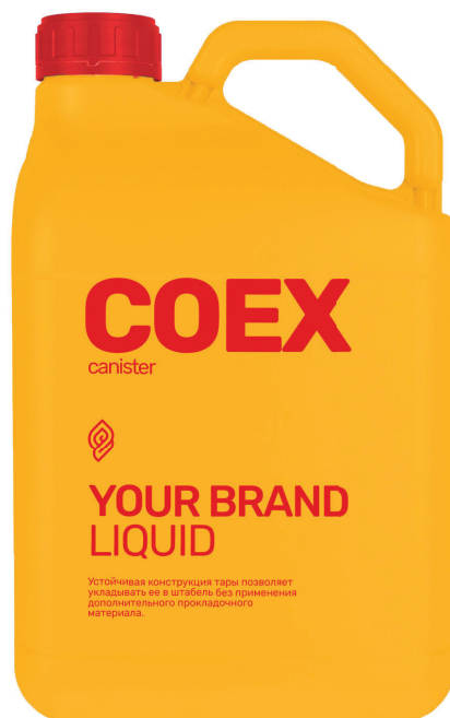
КАНИСТРА 10 Л